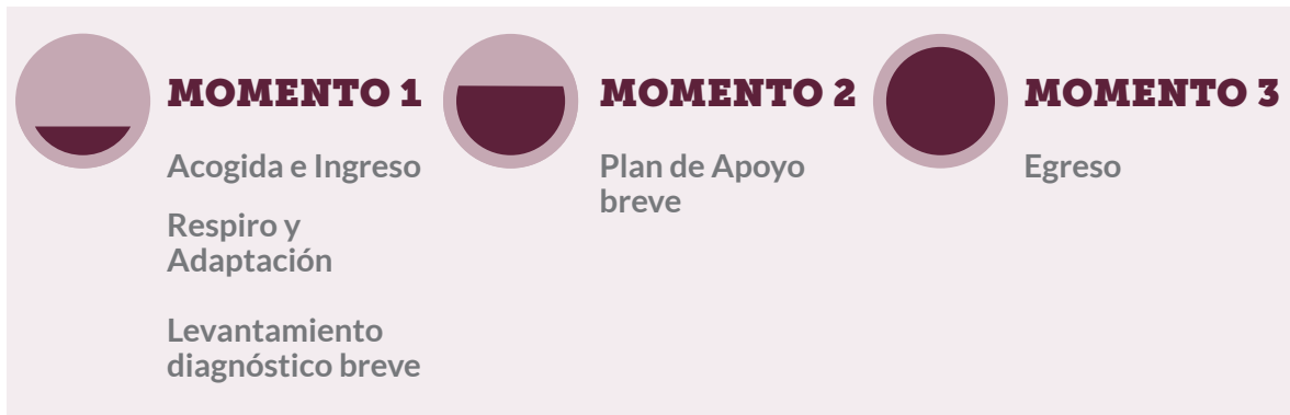
Figura N°1 Etapas del Proceso de Acompañamiento e Intervención

El proceso de intervención para las familias en situación de calle está compuesto de tres momentos, los cuales a continuación se detallan: